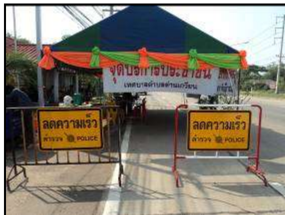
ภาพที่ 1 รูปแบบการตั้งจุดบริการ