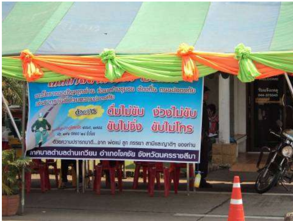
ป้ายรณรงค์บริเวณจุดตรวจ/บริการ