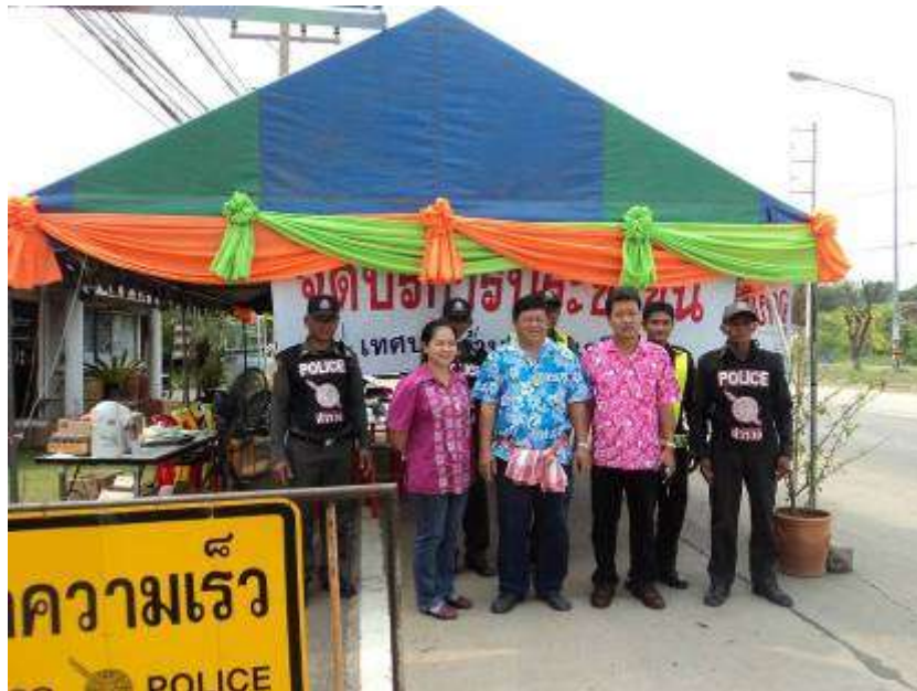
ผู้บริหารเทศบาลและเจ้าหน้าที่ตำรวจ