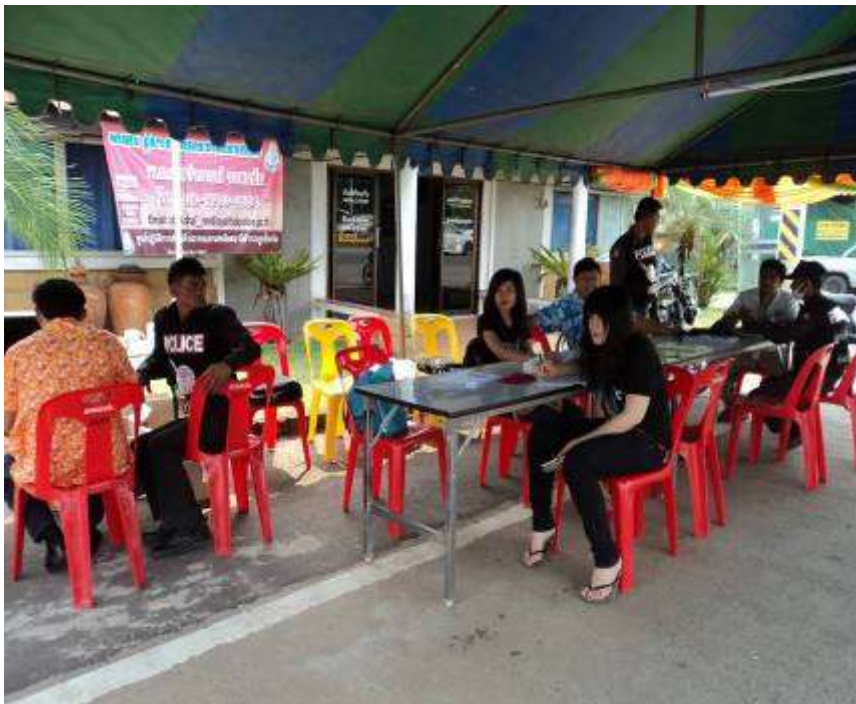
นักศึกษาสำรวจข้อมูลในจุดตรวจ/บริการ