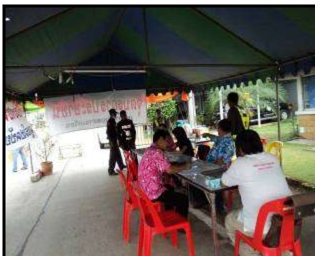
ภาพที่ 2 มีเจ้าหน้าที่ตำรวจเข้ามาตรวจความเรียบร้อยของจุดตรวจ/บริการ

ส่วนในเรื่องการสนับสนุนของชุมชน ส่วนใหญ่เป็นในเรื่องของการให้กำลังเจ้าหน้าที่ บางคนก็เข้ามา นั่งคุยด้วยในช่วงกลางคืน และบางส่วนก็ช่วยสนับสนุนในเรื่องอาหารและเครื่องดื่มให้กับเจ้าหน้าที่ด้วย