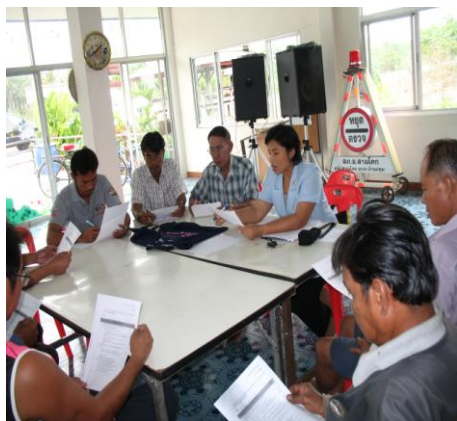
แกนนำประชุมวางแผนโครงการ