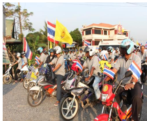
กลุ่มผู้ใช้รถมอเตอร์ไซค์ร่วมรณรงค์