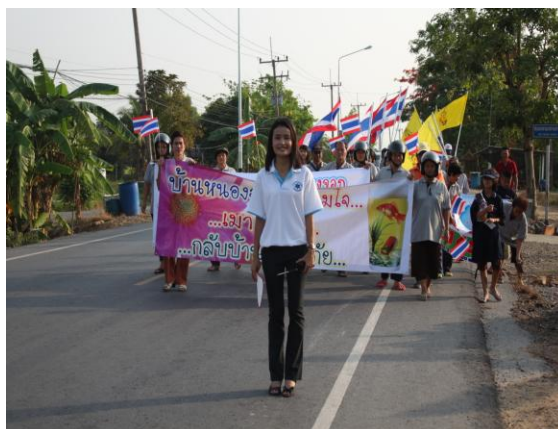
ขบวนการรณรงค์ ขับขี่ปลอดภัย