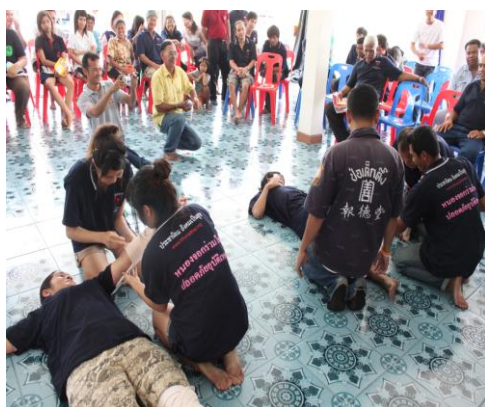
ประชุมเชิงปฏิบัติการ การช่วยเหลือผู้บาดเจ็บ