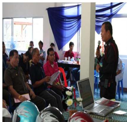
อบรมการขับขี่ปลอดภัย